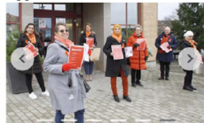
Ett av stoppen gjordes framför kommunhuset.

Andra aktiviteter vi har haft i år: ema-promenader i skogen (där vi tog upp Kvinnokonventionens stadgar och diskuterade), on-line kurs om Hälsa, patchwork sykurs (med bokade tider för att inte träffas för många samtidigt på kontoret), sykurs (med reducerat antal deltagare), målarkurs (med reducerat antal deltagare).